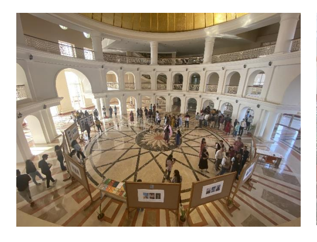
View of the exhibition