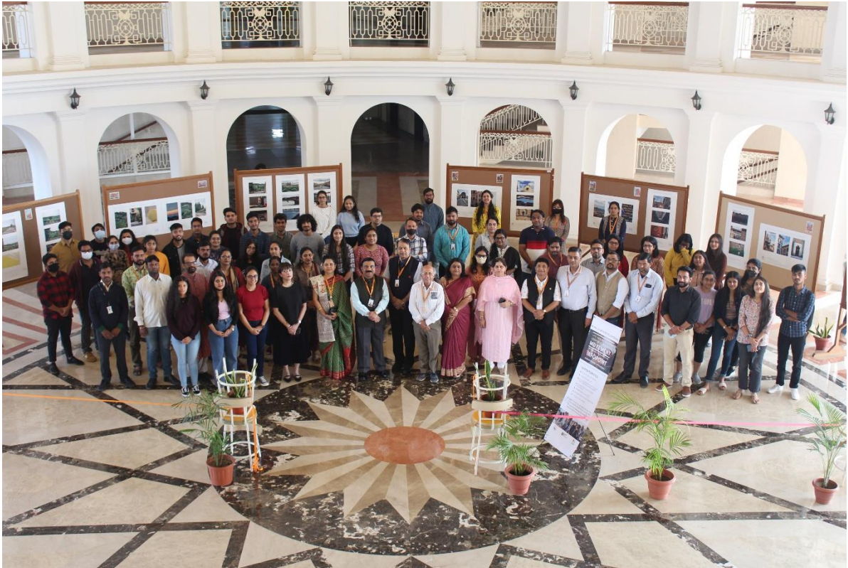
View of exhibition with all the attendees during its inauguration