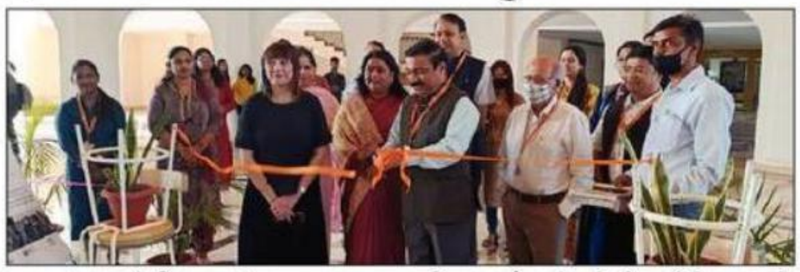
🔳 जलतेदीप, कासं, जयपुर

मणिपाल यूनिवर्सिटी जयपुर (एमयूजे) के स्कूल ऑफ आर्किटेक्कर एंड डिजाइन द्वारा द्रोणा फाउंडेशन के सहयोग से फ्लोरेंस इन द वर्ल्ड, द वर्ल्ड इन फ्लोरेंस एग्जीबिशन का आयोजन किया जा रहा है। यह एग्जीबिशन लाइफ बियॉन्ड टूरिज्म मूवमेंट; रोमुआल्डो डेल बियांको फाउंडेशन,फ्लोरेंस, इटली द्वारा समर्थित है।