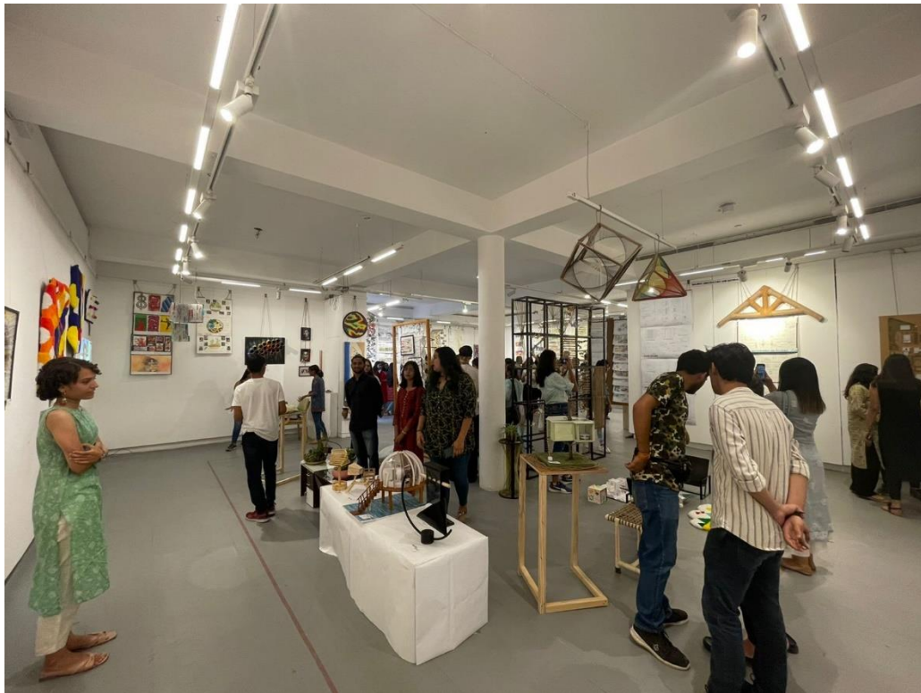
Students' Work Display at Sukriti Art Gallery at Jawahar Kala Kendra, Jaipur.