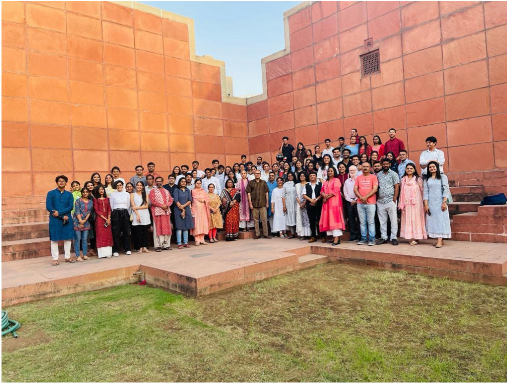
Group photograph at Jawahar Kala Kendra, Jaipur